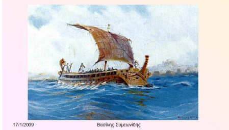
Σχήμα 1: αρχαία τριήρης πλέοντας με χρήση και του μεγάλου ιστίου

Αυτό βοήθησε ακόμη περισσότερο τους μαθητές να σχηματίσουν παραστατικά το σκηνικό, όπου διαδραματίστηκαν τα γεγονότα που αφηγείται το αρχαίο κείμενο (Ελευθεριάδης 2005).